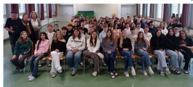
Drei von den wilden Alten in der Neuen Mittelschule von Kirchberg an der Raab im Bild rechts und in der Neuen Mittelschule in Fehring im Bild oben.

Faschismus, von den Gefahren, in die sich die Demokratie immer wieder begibt, wenn die Menschen lauten Populisten (wie eben Hitler) vertrauen, wenn sie sich, so wie viele der Eltern der wilden Alten, nur allzu leicht verführen lassen. Passt gut auf, auf unsere Demokratie, seid wachsam und lernt aus der Geschichte. Einen besonderen Stellenwert bei den Gesprächen nahm der Todesmarsch der ungarischen Juden durch die Oststeiermark ein. Eine fürchterliche Sache, die sich unmittelbar vor den Haustüren der Großeltern und Urgroßeltern der Schülerinnen und Schüler abspielte und von dem die wilden Alten ausführlich erzählten.